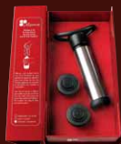
Coffret pompe à vin + bouchons Gift set : Vacuum pump + stoppers