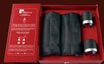
Coffret rafraîchisseur + bouchon à vin et à Champagne Gift set : Cooler + wine stopper + Champagne stopper