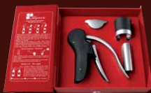
Coffret coupe capsule + tire bouchon + stop-gouttes + bouchon à vin Gift set : Foil cutter + corkscrew + wine pourer + wine stopper